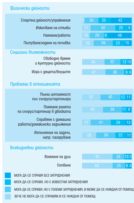
Фиг. 2. Способност за различни дейности на пациентите с ПХ (%)

нения, за да ги обсъдите целенасочено със своя лекар, медицинска сестра, семейство, полагащо грижи лице или пациентска организация. Отговорите ще ви помогнат да изясните и степенувате по приоритет проблемите, които са особено важни за вас.