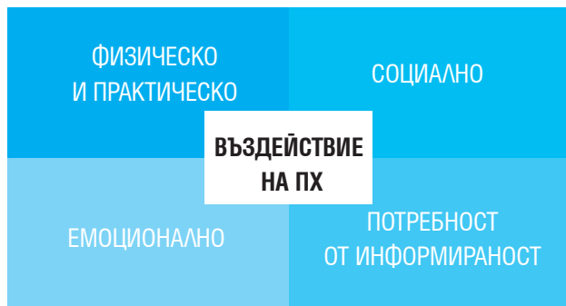
Фиг. 1. Проучвани области

Целта на проведеното през 2011 г. международно изследване е да се научи повече за въздействието на ПХ върху живота на пациентите и лицата, полагащи грижи за тях, професионалното им развитие в области, различни от физическите им симптоми. Изследването проучва четири основни области и формулира ключови изводи (фиг. 1).