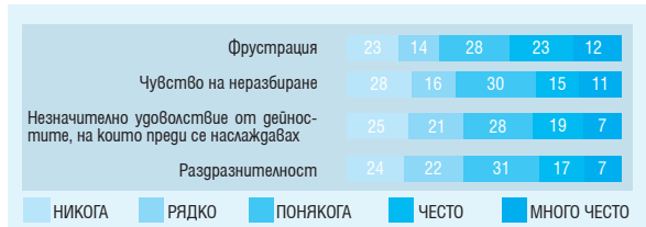
Фиг. 4. Честота на емоциите на пациентите през последния месец (%)

С пълните резултати можете да се запознаете на: http://www.phaeurope.org/projects-activities/pah-patient-and-carer-survey/